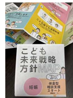
配布用の折り方の例 (外3つ折クロス2つ折)

（ご利用に当たっては、こども家庭庁HP掲載のコピーライトポリシー（ https://www.cfa.go.jp/copyright-policy/ ）をご確認ください。）