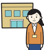
じ どう そうだんじょ 児童相談所など

か てい じ ぶん い ば しょ おも 家庭や自分の居場所でつらい思いを しているこどもが、相談できたり守って もらえる場所や仕組みをつくること