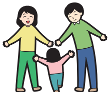
さとおやせいど 里親制度