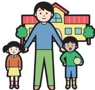
じ どう ようご し せつ 児童養護施設など