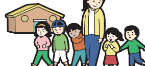
じ どう ほったつし えん 児童発達支援センター