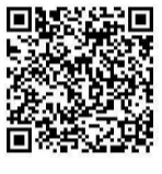
乳幼児突然死症候群 (SIDS) について