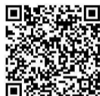
乳幼児突然死症候群 (SIDS) について