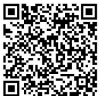
乳幼児突然死症候群 (SIDS) について