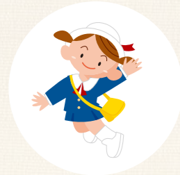
保育施設への 送り迎え