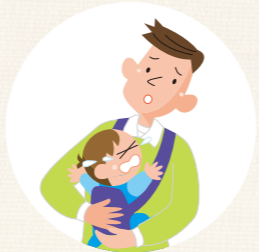
病児・病後児の預かりや 早朝・夜間などの緊急時に 預かる(一部地域で実施中)