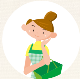
保護者が買い物など 外出の際、 子どもを預かる