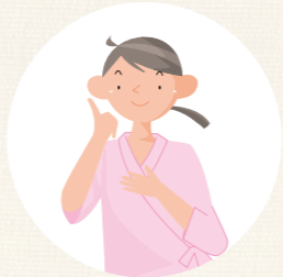
保護者の病気や 冠婚葬祭などの急用時に 子どもを預かる