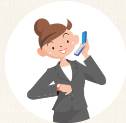
保育施設の時間外や、 学校の放課後などに 子どもを預かる