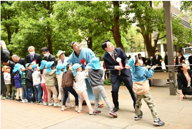
こいのぼりの掲揚