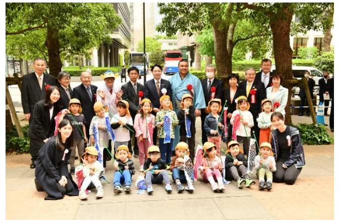
こいのぼり掲揚式出席者の記念撮影