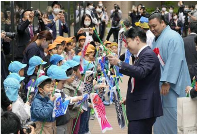
こどもたちにミニこいのぼりを手渡す大臣