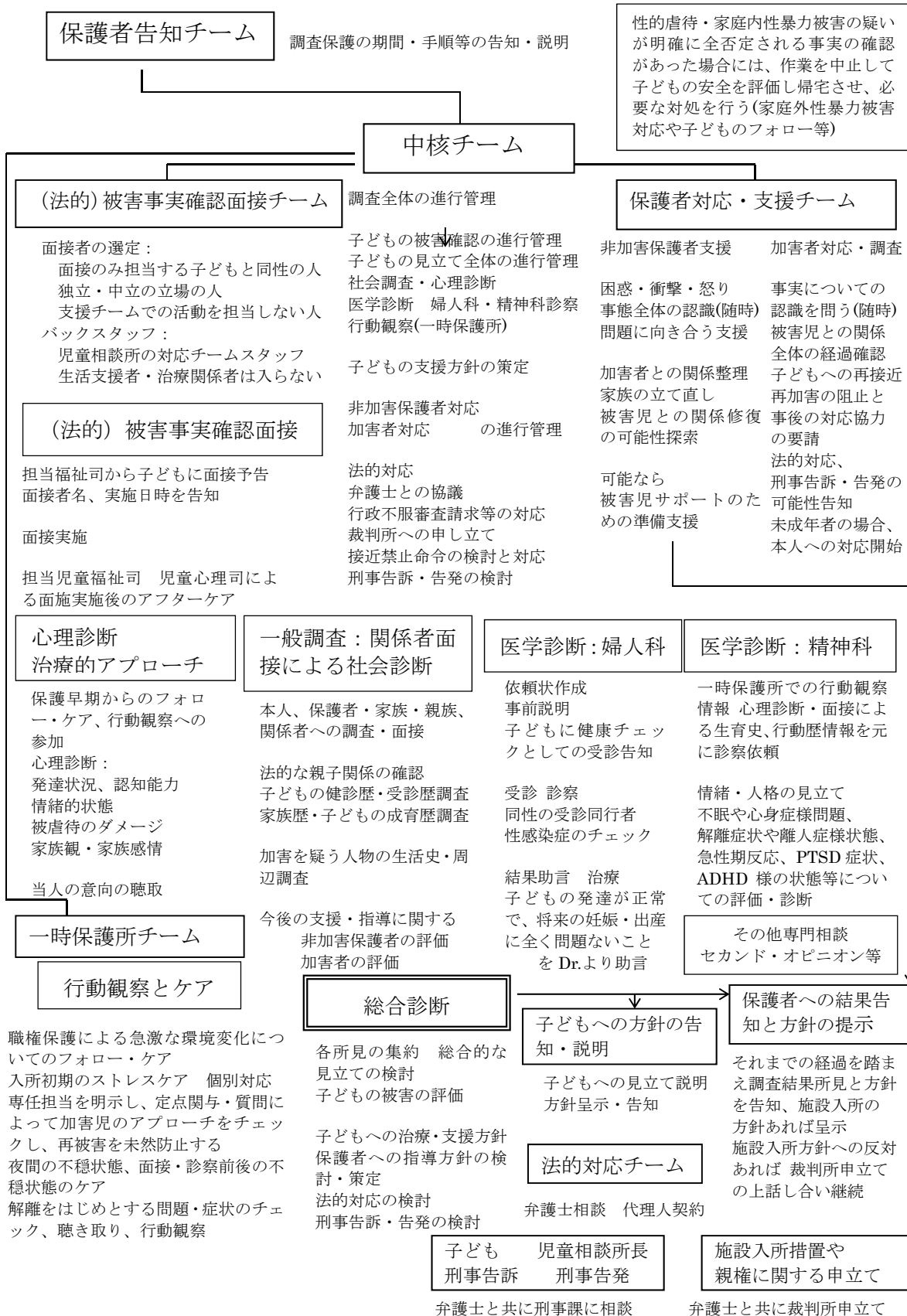
図 4-2 性的虐待・家庭内性暴力被害児の調査のための保護における作業手順イメージ