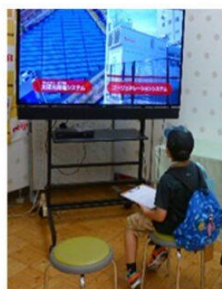
『カレーの展示』 食品製造課