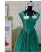
遺伝子組換えカイコを用いたドレス 『育種の展示』 研究企画課