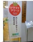
ノゾクアワードののぼり 『農福連携の展示』 農福連携推進室