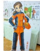
等身大の 林業女子パネル 『林業の展示』 林野図書資料館