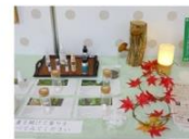
繪アロマで森の香り 『特用林産物の展示』 特用林産対策室

Tips 実際の食品などを展示すると自然とにおいが立ち込めるカレーのスパイス、ガムなど