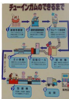
『ガムの展示』 食品製造課