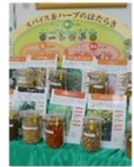
スパイスの笑 『カレーの展示』 食品製造課