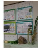
てんさい・さとうきび 『砂糖の展示』 地域作物課