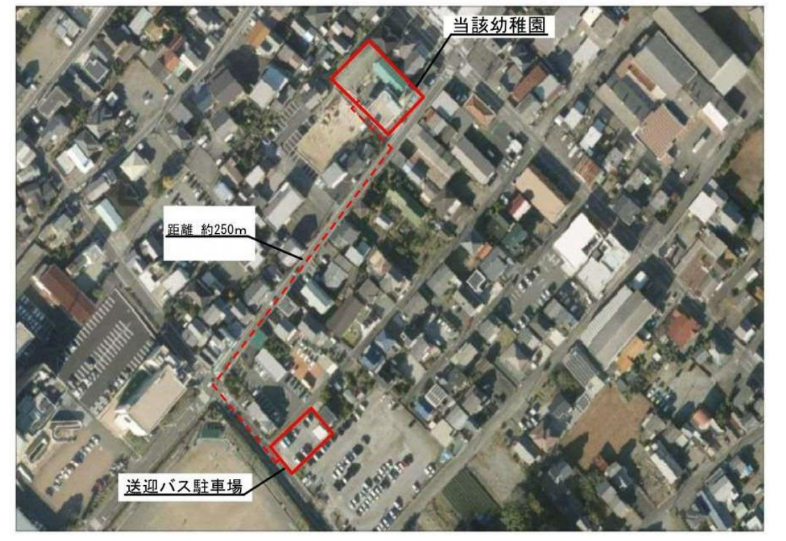
施設と駐車場との位置図