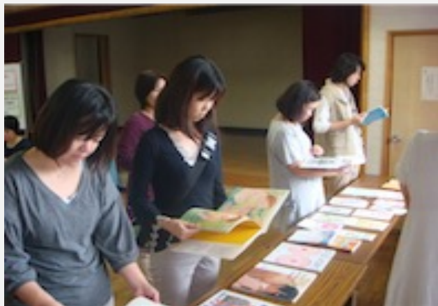
＜絵本を使って性の話を＞ 子育て支援保育士×図書館