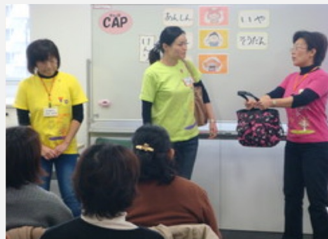
NPOによるワークショップ (子どもへの暴力防止プログラム)