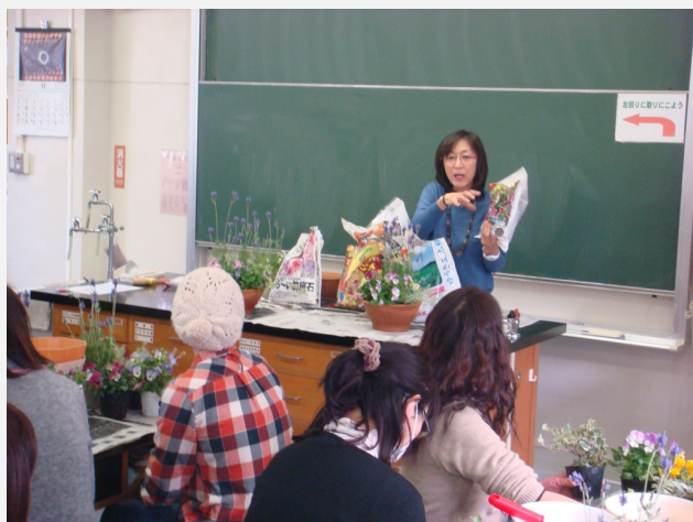
街の花屋さんによる寄せ植え講座 & 子育て井戸端会議