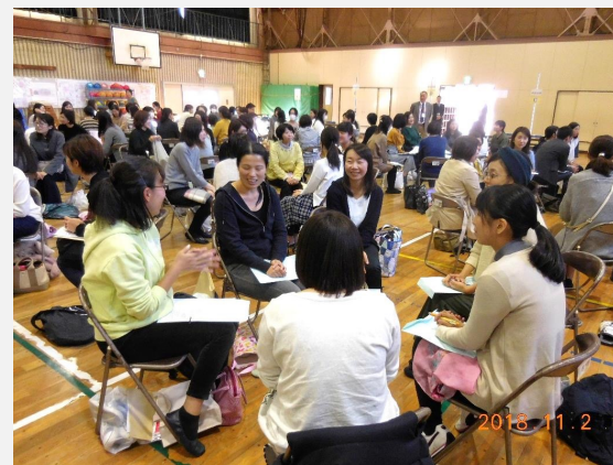
小学校就学時 健診の時の講座