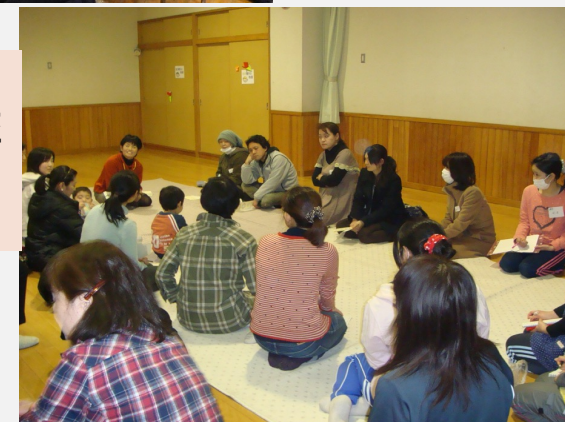
保育所での 子育て講座 ～お迎えの 時間に～