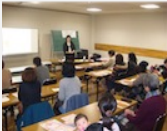
＜子育てしている時のわたしの心と体＞ 保健センター・臨床心理士・保育士・・・