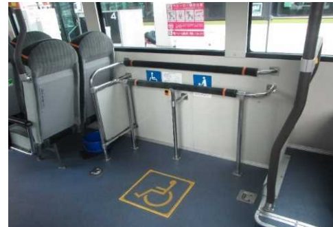
バス車両に設けられたフリースペース