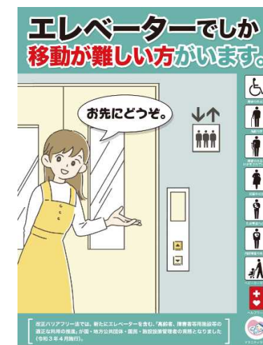
優先席やエレベーターの適正利用を促すポスター