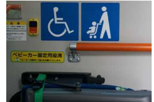
バス車内におけるベビーカー固定用座席