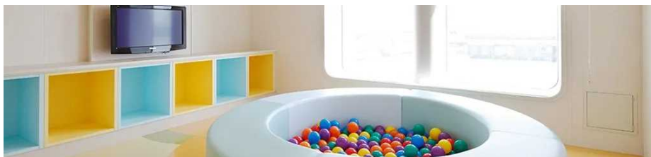
旅客船における子ども専用スペース