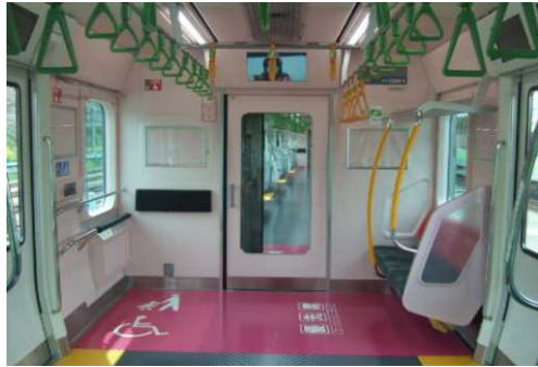
鉄道車両に設けられたフリースペース

鉄道・バス事業者において、ベビーカー優先スペースの設置、乳幼児連れの方への温かい見守りを求めるステッカーの掲出、鉄道駅等でのベビーカー貸出、キッズコーナーの設置、駅内外での保育園開設等の実施。