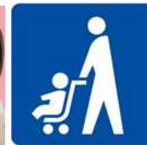
ベビーカーマーク