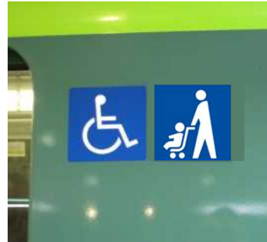
鉄道車両の車外のベビーカーマーク