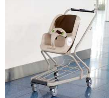
空港におけるベビーカー貸し出し