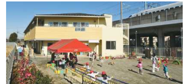
鉄道駅等に併設された施設に保育園等の設置