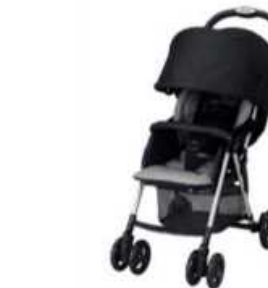
鉄道駅等でのベビーカーの貸し出し