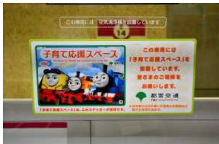
鉄道車両の装飾を施した子育て応援スペースを設置していることを示すステッカーの掲出