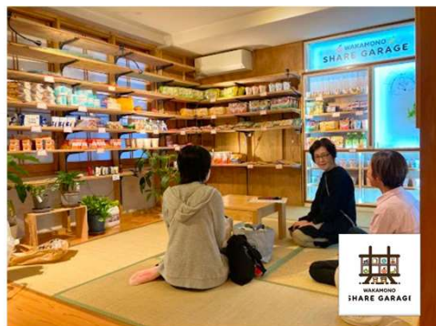
若者シェアガレージ

既存の居場所に 該当しない・通えない相談者 に対し、ひとり一人の希望や、興味・関心に合わせて、 オーダーメイドの居場所 をつくる