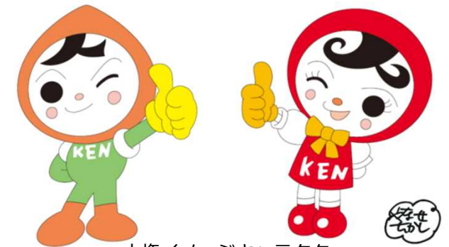
人権イメージキャラクター 人KENまもる君 人KENあゆみちゃん