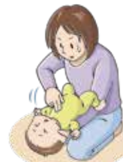
図4: 胸部突き上げ法 (乳児)