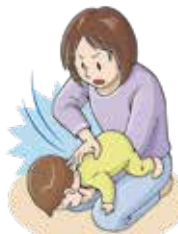
図3: 背部叩打法 (乳児)