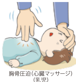
胸骨圧迫(心臓マッサージ) (乳児)