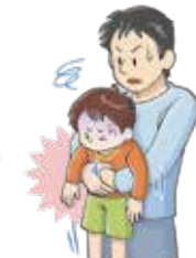
図2: 腹部突き上げ法 (幼児)