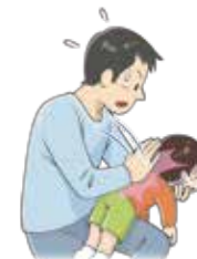
図1: 背部叩打法 (幼児)